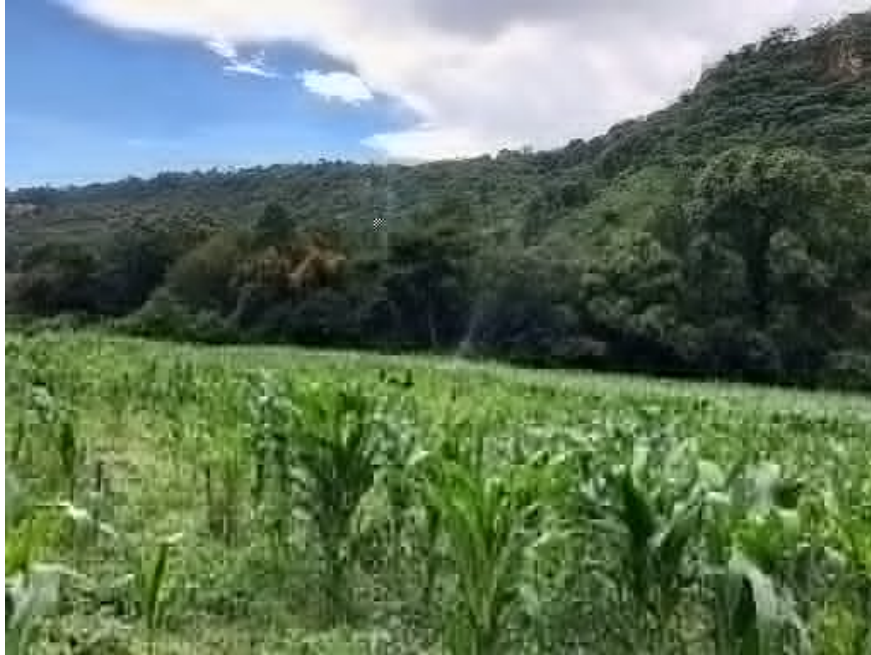
Figura 2. Área experimental