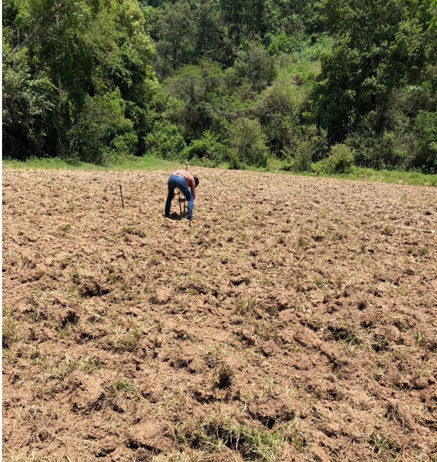
Figura 22. Delimitación de tratamientos en la parcela