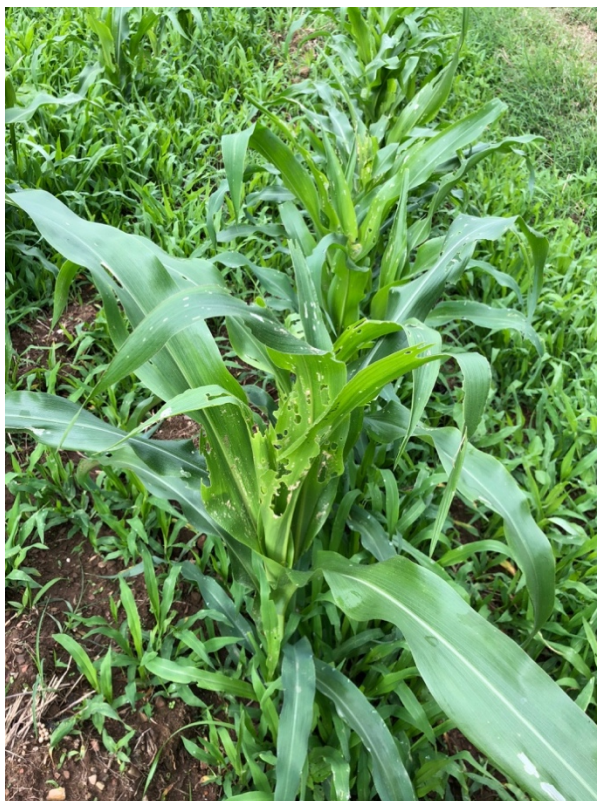
Figura 23. Producción de maíz en etapa fenológica media