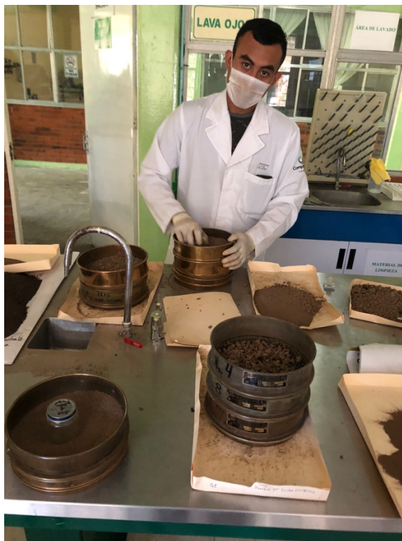
Figura 13. Tamizado de muestras de suelo

El color del suelo, fue determinado por la técnica de Munsell (Munsell, 1990) y la densidad aparente por el método de probeta, esta técnica utiliza el suelo seco al aire, molido y tamizado con malla de 2 mm, y luego se coloca una masa de suelo conocido en una probeta de 100 mL y luego de una serie de golpes se vuelve a pesar. Todas estas determinaciones corrigen la masa del suelo según la humedad de la muestra.