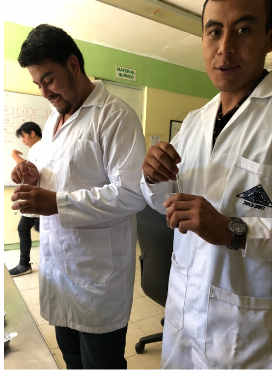
Figuras 15 y 16. Determinación de pH de las muestras de suelo