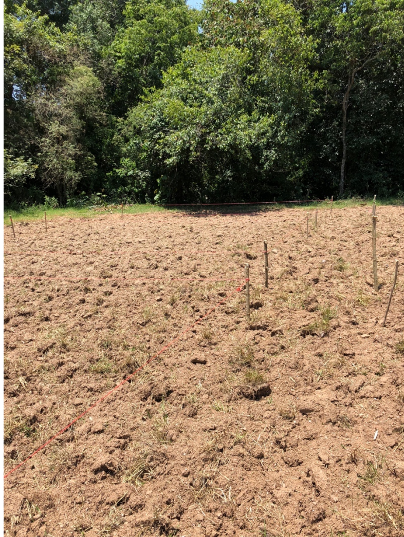
Figura 3. Alineación y trazado de surcos para establecimiento

Los tratamientos serán: T1 = Fertilización tradicional; es el tratamiento utilizado por el productor sin tomar en cuenta características del suelo y/o necesidades del cultivo. Serán utilizados como fuentes de Nitrógeno (N), Fósforo (P) y Potasio (K), fertilizantes químicos comerciales: Urea 46-00-00, Fosfato Diamónico (DAP) 18-46-00, Cloruro de Potasio (KCl) 00-00-60, en dosis de 180-90-40 Unidades por Ha, es decir, se utilizaron 314.76, 195.65, y 66.66 Kg, respectivamente.