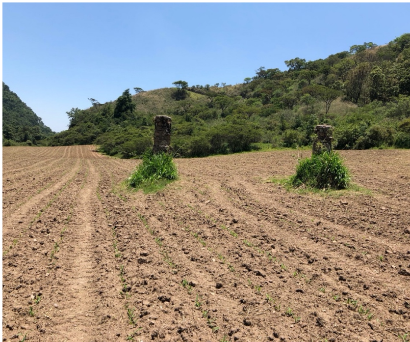
Figura 20 y 21. Delimitación del área experimental