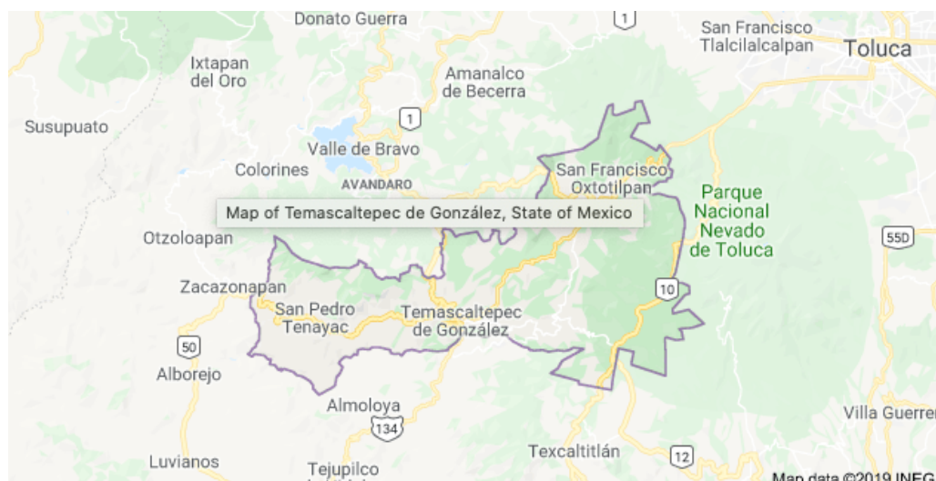
Figura 1. Ubicación del experimento

La localidad de Telpintla está situado en el Municipio de Temascaltepec, Estado de México, ligeramente hacia el sudeste de Toluca, en las coordenadas geográficas 100° 02' longitud Oeste y 19° 03' de latitud Norte y 1849 msnm.