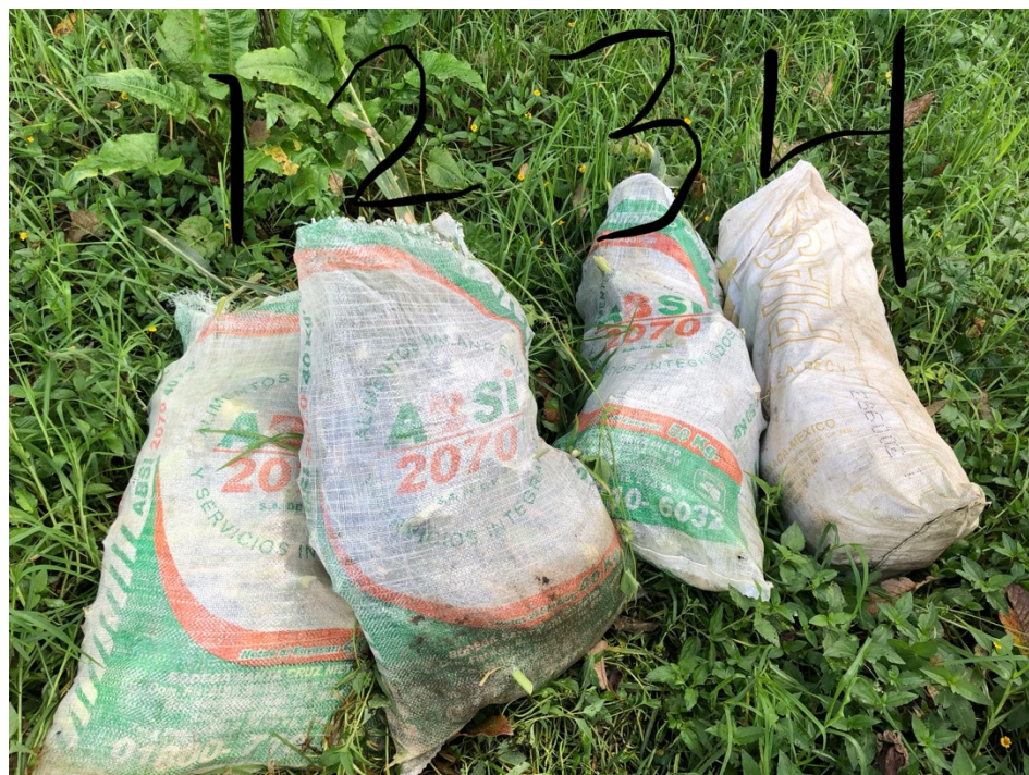
Figura 24. Toma de muestras de mazorcas para pesado