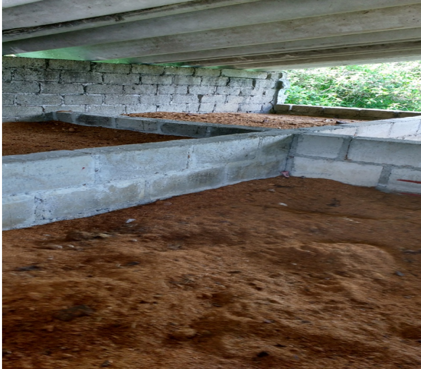
Figura 6. Composta de residuos orgánicos en descomposición