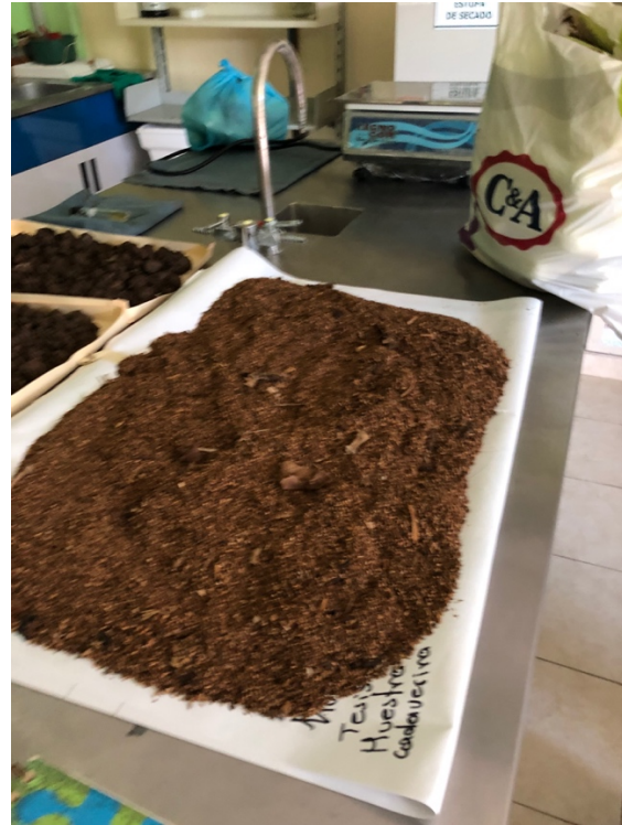
Figuras 11 y 12. Muestras en el Laboratorio secadas a temperatura ambiente