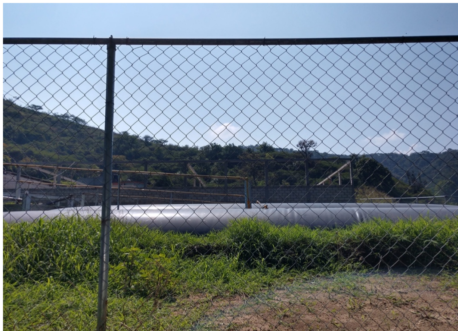
Figuras 8 y 9. Biodigestor en la Granja "Las Pulgas"