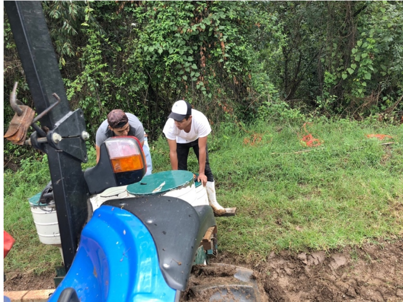
Figuras 19. Alineación para la siembra

Para determinar esta variable, se realizaron los cálculos necesarios para densidad de siembra y Kg de maíz/ha cosechados por tratamiento.