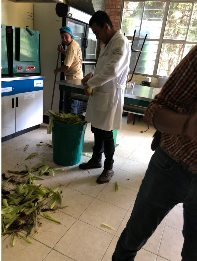
Figura 25. Pesado de mazorcas en laboratorio