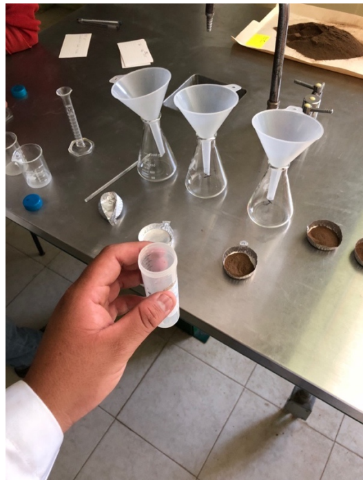
Figuras 17 y 18. Determinación de minerales en laboratorio