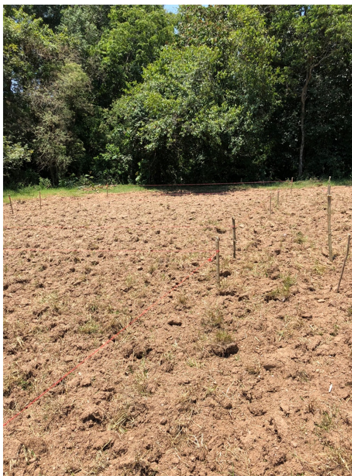
Figura 10. Arreglo de los tratamientos experimentales.

QP=Tratamiento Químico productor, CB= Tratamiento Composta+Biol, QB=Químico + Composta, QF= Químico formulado.