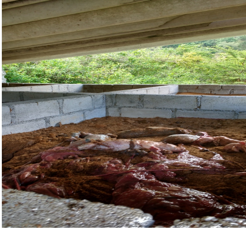
Figuras 4 y 5. Composta de residuos orgánicos etapa inicial