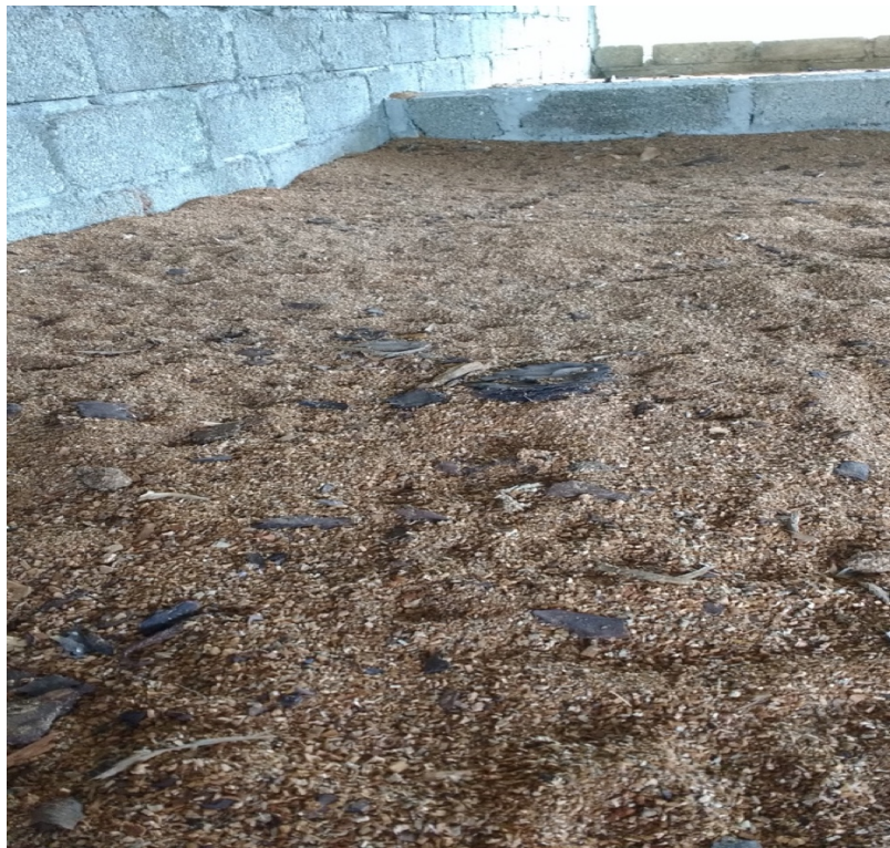
Figura 7. Composta de residuos orgánicos etapa final