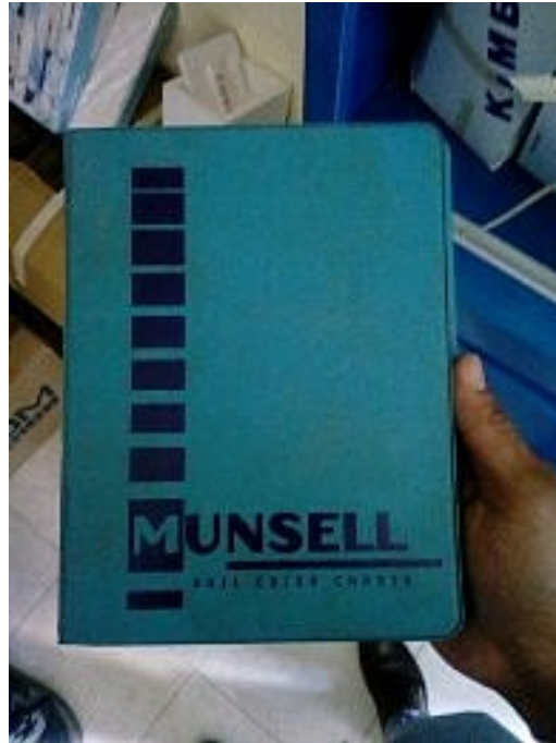
Figura 14. Determinación de color en laboratorio